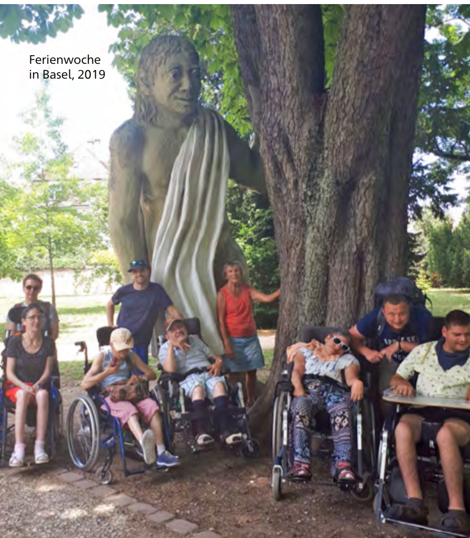
Ferienwoche in Basel, 2019