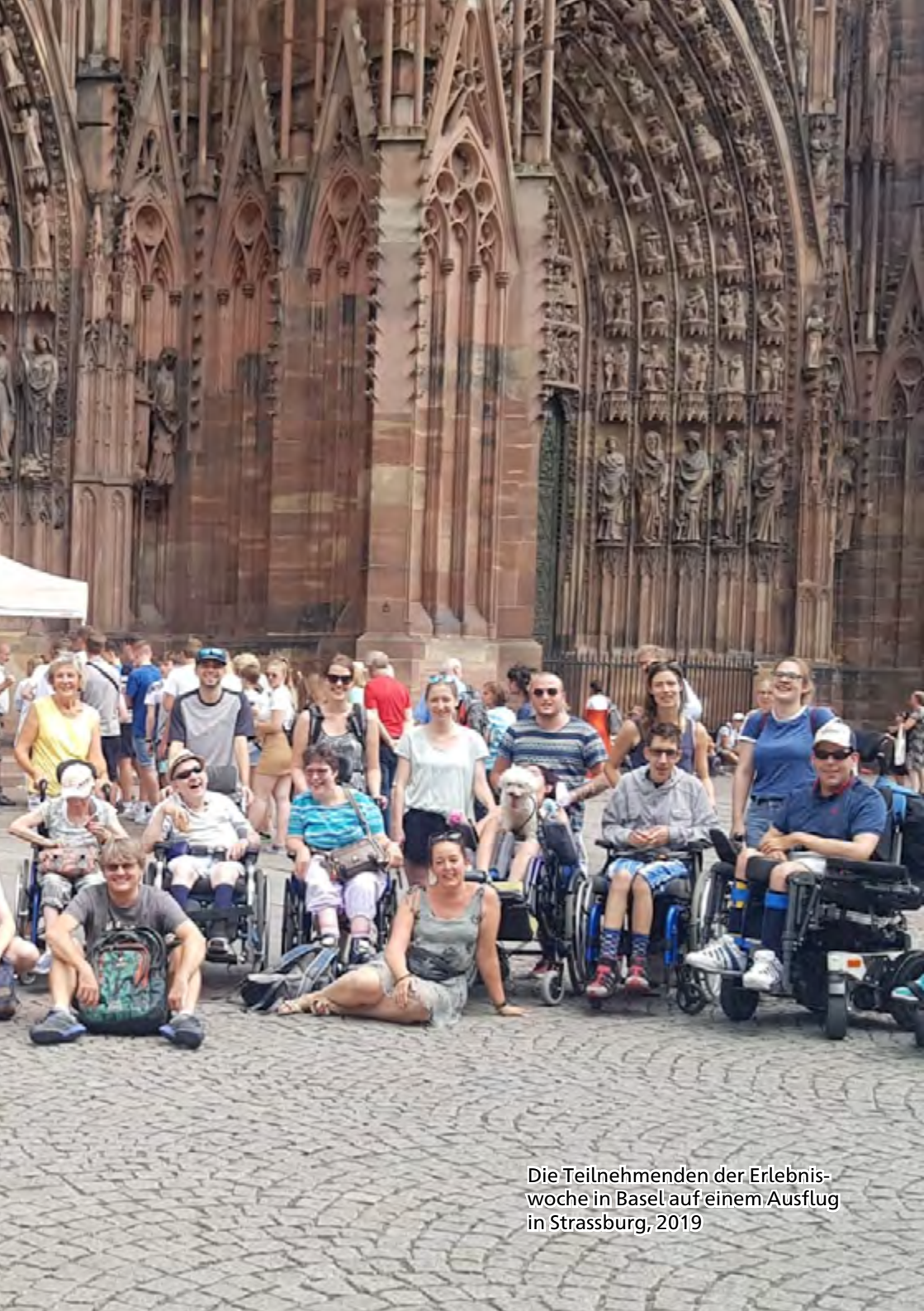
Die Teilnehmenden der Erlebnis- woche in Basel auf einem Ausflug in Strassburg, 2019