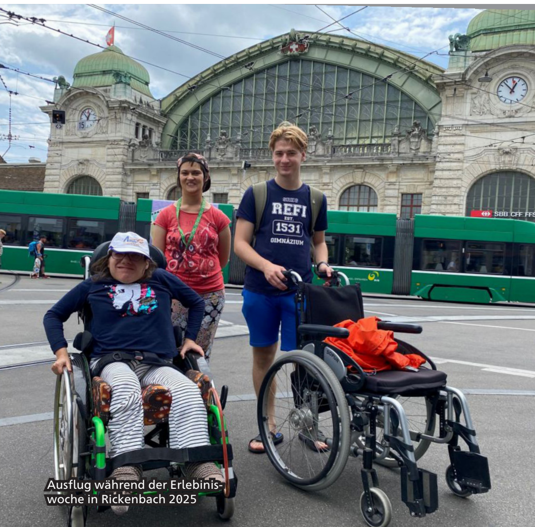
Ausflug während der Erlebinis- woche in Rickenbach 2025